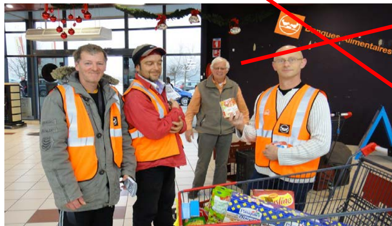
Logo de travers