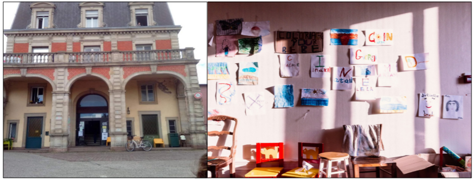
La Roue Tourne

JMV est une structure de l'économie solidaire (chantier d'insertion) spécialisée dans la production et la vente de légumes, de fruits et de produits certifiés Bio et l'accompagnement des consommateurs. Elle s'est associée au Secours Populaire pour la gestion de l'épicerie sociale à laquelle ont accès les bénévoles et les salariés du chantier d'insertion.